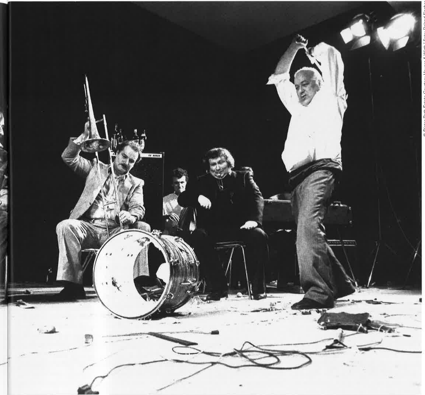
© Dieter Roth Estate Courtesy Hauser &amp; Wirth | Foto: Roland Fischer